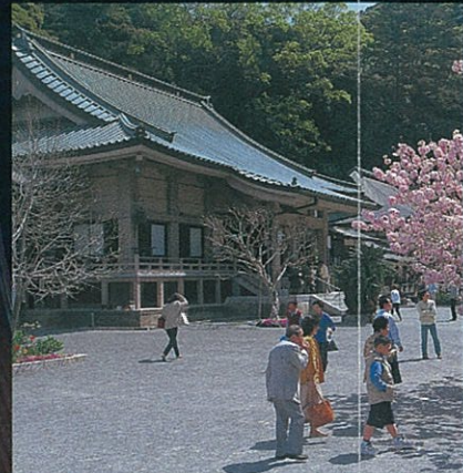
ちんこくじ 鎮国寺

고대부터 '길의 신'으로 여겨져 항해 및 교통 안전을 기원하기 위해 많은 사람들의 발길이 이어집니다.