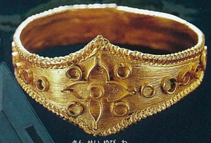
きんせいゆびわ 金製指輪 금반지