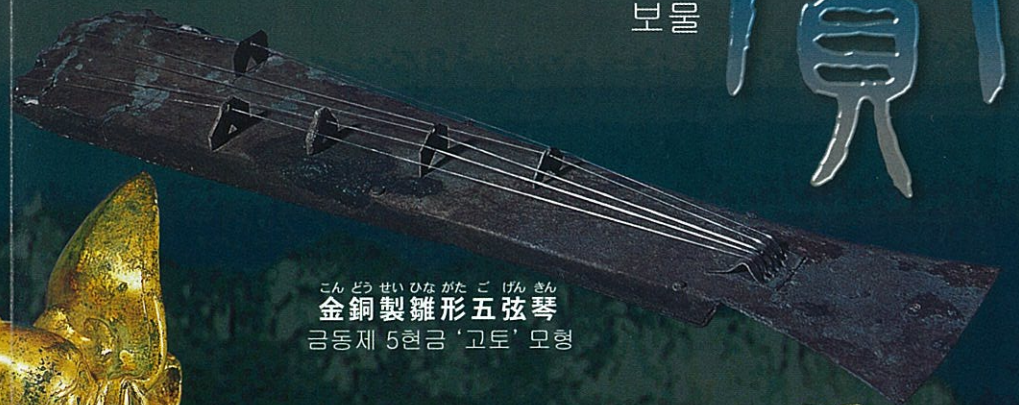
こんどうせいひながたごげんきん 金銅製雛形五弦琴 금동제 5현금 '고토' 모형