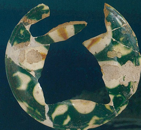
とうさんさい 唐三彩 당삼채