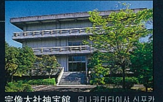
宗像大社神宝館 무나카타타이샤 신보관

오키노시마에서 발견된 대부분의 출토품은 '무나카타타이샤 신보관'에서 보실 수 있습니다.