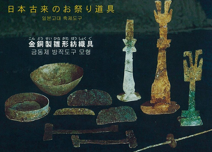
こんどうせいひながたぼうしやく 金銅製雛形紡織具 금동제 방직도구 모형