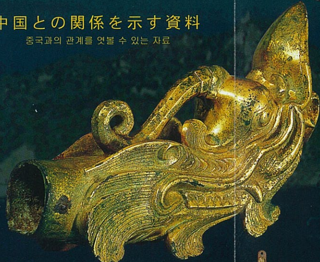
こんどうせいりゅうとう 金銅製龍頭 금동제 용두