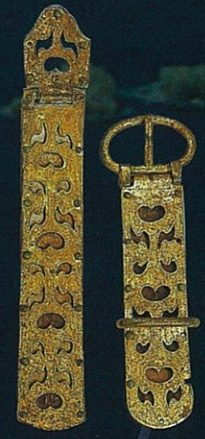
こんどうせいばく 金銅製馬具 금동제 승마도구